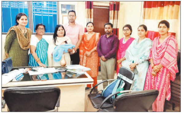
नवजात शिशु के साथ अधिकारियों की टीम।