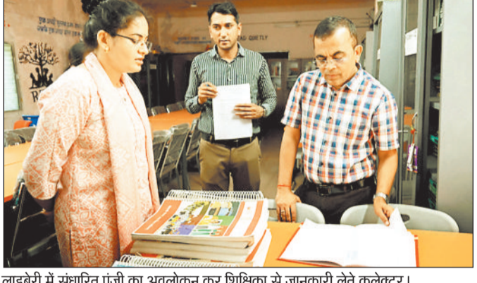
लाइब्रेरी में संचारित पंजी का अवलोकन कर शिक्षिका से जानकारी लेते कलेक्टर।

डूजेन सिस्टम को दुरुस्त करने और पानी की टंकी की नियमित सफाई सुनिश्चित करने के निर्देश भी दिए। कलेक्टर ने शौचालयों की साफ-सफाई और रखरखाव को प्राथमिकता देने के निर्देश दिए। इसके अलावा विद्यालय में स्थापित सेनेटरी नैपकिन वैंडिंग मशीन के सुचारू संचालन करने के निर्देश दिए। कलेक्टर