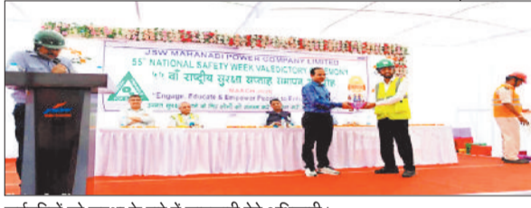
कर्मचारियों को सुरक्षा के बारे में जानकारी देते अधिकारी।

हरिभूमि न्यूज►► अकलतरा जेएसडब्ल्यू महानदी पावर कंपनी लिमिटेड में 55वें राष्ट्रीय सुरक्षा सप्ताह के समापन अवसर पर विशेष कार्यक्रम का आयोजन किया गया। कार्यक्रम का उद्देश्य कार्यस्थल